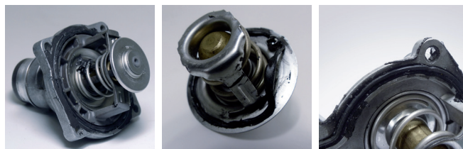
Εικόνα 1: Θερμοστατές με πρόσθετο στεγανοποιητικό υλικό

Συχνά, εφαρμόζεται τόσο πολύ στεγανοποιητικό, με αποτέλεσμα μέρη του καταλήγουν στο κύκλωμα ψύξης. Αυτά στη συνέχεια κολλάνε εκεί και φράζουν τον θερμοστάτη ή τους λεπτούς σωλήνες του ψυγείου αντιψυκτικού – συνεπώς, η ροή παρεμποδίζεται και η απαγωγή θερμότητας μειώνεται.