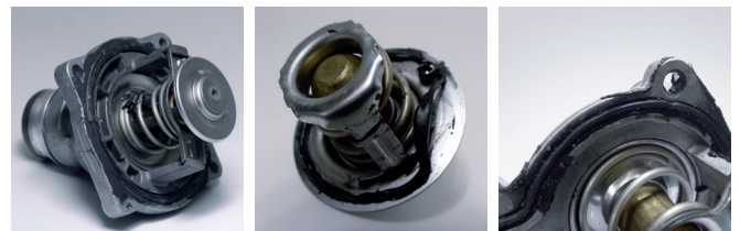
Figura 1: Termostatos con pasta sellante adicional

A menudo se aplica demasiado sellante y parte del mismo va a parar al circuito de refrigerante donde se sedimenta y bloquea el termostato o los tubos finos del radiador de refrigerante, con lo que se bloquea el flujo y se reduce la evacuación térmica.