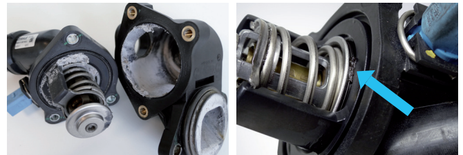
Figure 2: Sealant, foreign objects, and residues cause thermostats to malfunction and become blocked.