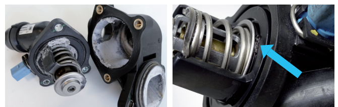
Abbildung 2: Dichtmittel, Fremdkörper und Rückstände führen zu Fehlfunktionen und Blockaden des Thermostats