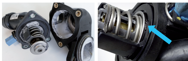
Иллюстрация 2: Герметик, посторонние частицы и отложения приводят к неисправностям и блокированию термостата