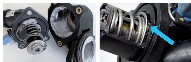
Figure 2 : Produits d'étanchéité, corps étrangers et résidus entraînent des dysfonctionnements et des colmatages du thermostat