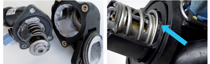
Resim 2: Dolgu macunu, yabancı madde ve kalıntılar termostatın arıza yapmasına ve tıkanmasına yol açar