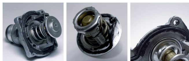
Figure 1 : Thermostat avec pâte à joint supplémentaire

On applique souvent une telle quantité de produit d'étanchéité que des fragments pénètrent dans le circuit de refroidissement, où ils se déposent et bloquent le thermostat ou les fines durites du radiateur de refroidissement : le débit est bloqué et la dissipation thermique réduite.