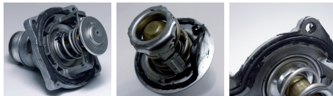
Иллюстрация 1: Термостаты с дополнительным герметиком

Зачастую наносится так много герметика, что его излишки попадают в контур охлаждения. Такие загрязнения остаются внутри контура и блокируют термостат либо тонкие трубки радиатора охлаждающей жидкости — поток охлаждающей жидкости снижается и отвод тепла сокращается.