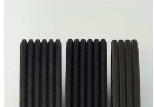
Mit bloßem Auge nur schwer zu erkennen: Die modifizierten Profilarten