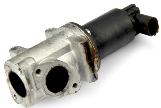
AGR-Ventil (VEMO Nr.: V40-63-0015) mit Rußablagerungen.