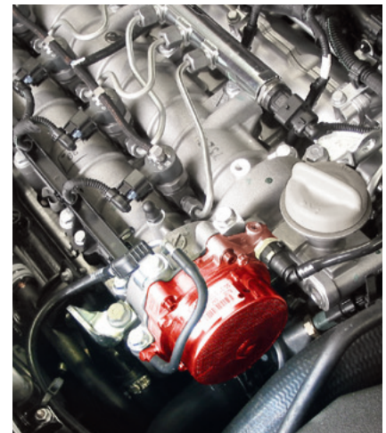
Vakuumpumpe im Opel Vectra C (hervorgehoben)

Änderungen und Bildabweichungen vorbehalten. Zuordnung und Ersatz, siehe die jeweils gültigen Kataloge bzw. die auf TecAlliance basierenden Systeme.