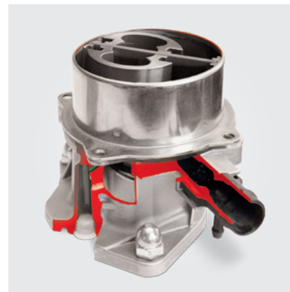
Stand der Technik: Einflügel-Vakuumpumpe (Schnittmodell)

Weiterverwendung einer gebrauchten Vakuumpumpe an einem überholten Motor: Vakuumpumpen sind mit dem Motor verbunden und werden je nach Bauform an den Motorölkreislauf angeschlossen. Nach einem Motorschaden kann es sein, dass: