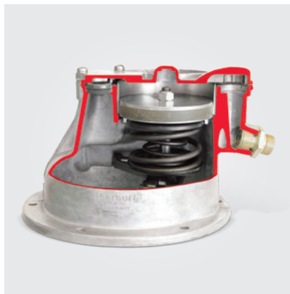
Eine klassische Kolbenvakuumpumpe (Schnittmodell)