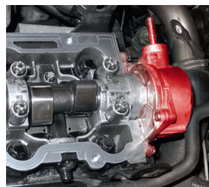
Vakuumpumpe und Nockenwelle im Opel Vectra B (hervorgehoben)