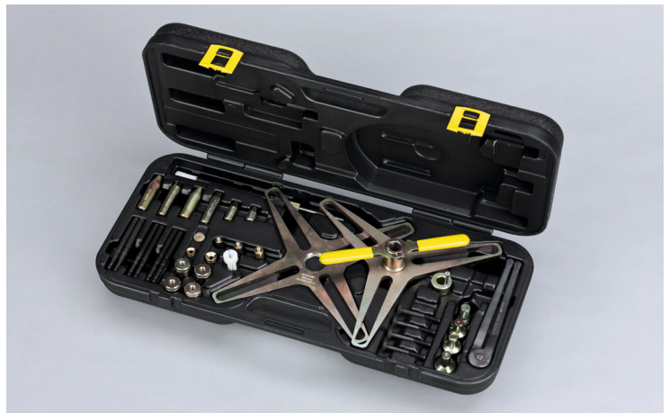
Bild 1: Spezialwerkzeug 400 0237 10 für die Kupplungsmontage