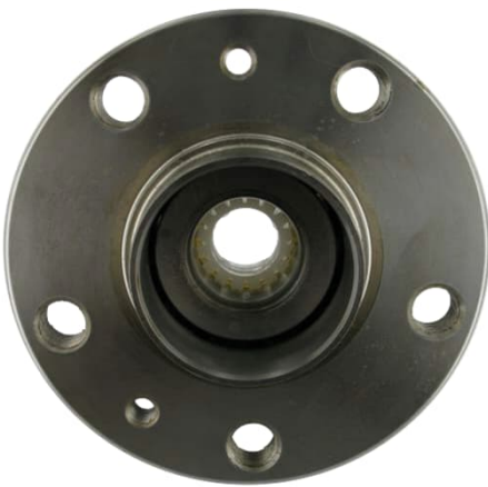
Lager mit Kunststoff Transportsicherung

Die Kunststoffhülse schützt das Radlager vor Transportschäden. Das VKBA 3606 wird mit einer Kunststoffhülse geliefert, der die Innenringe zusammenhält, bis zur Montage des Lagers.