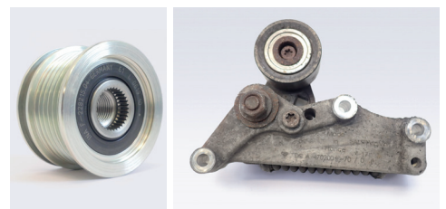
Abbildung 3: Generatorfreilauf und Riemenspanndämpfer immer mit prüfen