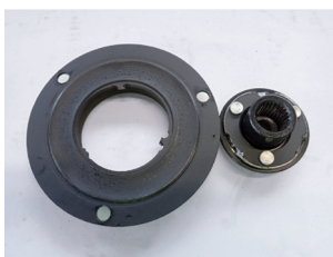
Abbildung 1: Ausgelöste Überlastsicherung

Eine Hauptursache für das Auslösen der Sicherung sind ungleichmäßige Schwingungen. Am häufigsten sind dafür defekte Bauteile wie die Freilaufriemenscheiben am Generator, der Riemenspanndämpfer oder der Schwingungsdämpfer der Kurbelwelle verantwortlich. Wechselnde oder zu hohe Krafteinwirkung kann ebenfalls die Sicherung auslösen. Ursachen hierfür können etwa ein unrunder Motorlauf, harte Gangwechsel oder eine Drehmomentsteigerung durch Chiptuning sein. In seltenen Fällen schlagen Schwingungen die Verzahnung der Riemenscheiben auf der Antriebswelle des Kompressors aus, ohne dass die Überlastsicherung auslöst. Dabei wird die Verzahnung so lange abgetragen, bis die Kraftübertragung und Kältemittelförderung zusammenbricht. Ein Hinweis darauf kann eine gelöste oder fehlende Zentralschraube der Riemenscheibe sein.