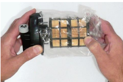
2. Filter im Beutel auf Deckel aufstecken