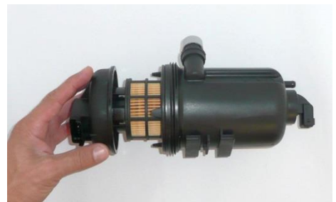
3. Beutel abziehen und ins Gehäuse montieren