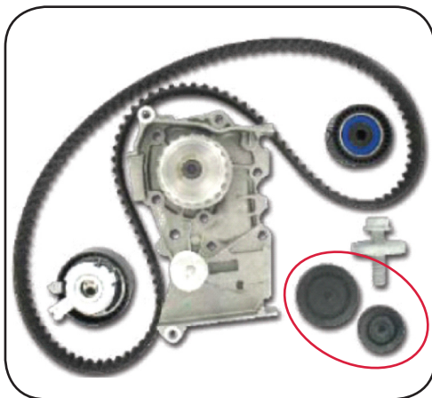
Beispiel SKF Kit