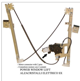
- Motor connector with 2 pins - Connecteur moteur avec 2 contacts POWER WINDOW LEFT ALZACRISTALLI ELETTRICO SX

Lève-vitre de remplacement / Ersatz-Fensterheber Alzacristalli di ricambio / Elevavinas de recambio