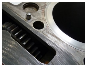
Motorblock- dichtflächen mit Stirnrad

Die Standarddichtung (Dicke: 1,2 mm; Elring Art.-Nr. 021.262 oder 357.831) ist hierzu nicht vorgesehen. Ansonsten greifen die Zahnflanken der Stirnräder zu stark ineinander. Dies kann zu schnellem Verschleiß und Schäden führen. Elring hat für die nachhaltige, umweltschonende Instandsetzung des Motors eine um 0,3 mm dickere Zylinderkopfdichtung entwickelt. Sie gleicht die Materialabnahme aus.