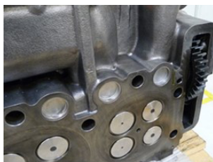
Zylinderkopf- dichtfläche mit Stirnrad

Die konstruktive Anordnung der Ventilsteuerung durch Stirnräder in Zylinderkopf und Motorblock (siehe Bilder) macht es notwendig, dass das durch die maschinell bearbeitete Dichtflächen abgenommene Material durch eine entsprechend dickere Reparaturstufen Zylinderkopfdichtung ausgeglichen wird.