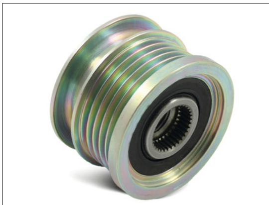
Bild 2: Generatorfreilauf 535 0143 10

Als technische Lösung bietet Schaeffler Automotive Aftermarket für diese Fahrzeuge einen Generatorfreilauf an. Dieser mindert die dynamischen Belastungen im Nebenaggregatetrieb und verhindert so die Geräuschbildung.