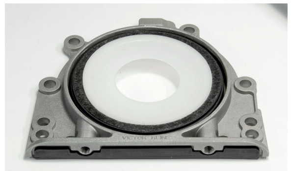
Abbildung 2_Unterseite integrierter Wellendichtring

VICTOR REINZ – der beste Weg eine gute Dichtung zu bekommen.