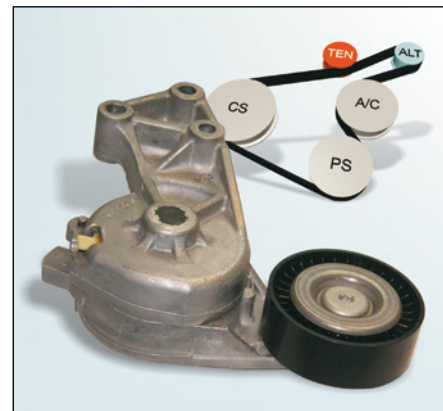
Bild 2: Im 1.9 TDI-Motorverbauter Spannarm 534 0132 30 mit Riemenverlauf

Durch starke dynamische Bewegungen des Keilrippenriemens kann es bei diesem Motor zur Geräuschbildung kommen.